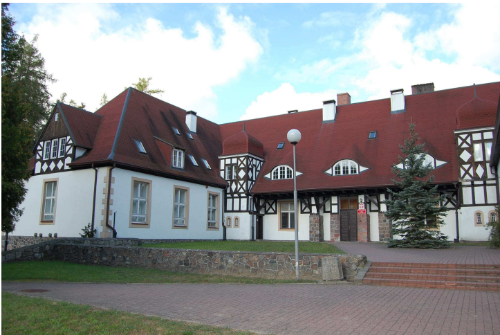
Budynek zabytkowej maszталarni w Goraju

W Bzowie znajduje się pałac zbudowany ok. 1880 roku. Stylem nawiązuje do typu renesansowej rezydencji. Poniżej zdjęcie pałacu.