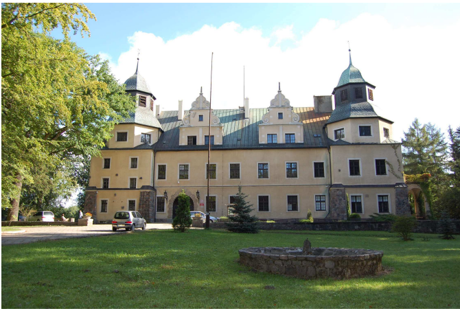
Zamek w Goraju