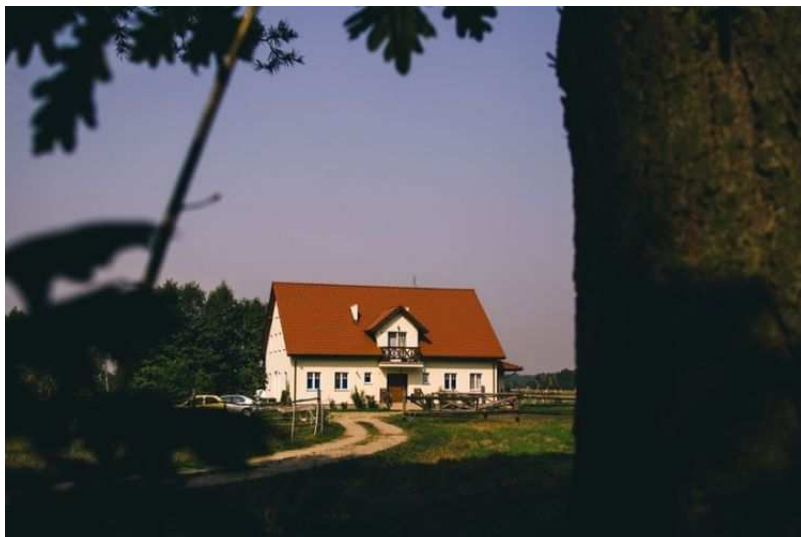
Foto: Chata Miłkowska – zdjęcie pochodzi ze strony internetowej www.milkowo.pl

Ze względu na zapotrzebowanie na materiały związane z rolnictwem w obrębie Lubasza prowadzona jest również działalność związana z produkcją rolniczą. Bliskie położenie jeziora oraz drogi wojewódzkiej sprawia, że branża hotelowo – cateringowa zwłaszcza w okresie letnim daje zatrudnienie części mieszkańców nie tylko samego Lubasza. W miejscowości Miłkowo powstało także gospodarstwo agroturystyczne. Obsługa rolnictwa zajmuje się Stacja Paliw PALMAT.