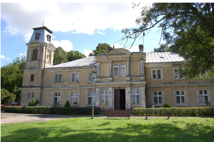
Pałac w Bzowie

W Bzowie znajduje się pałac zbudowany ok. 1880 roku. Stylem nawiązuje do typu renesansowej rezydencji. Poniżej zdjęcie pałacu.