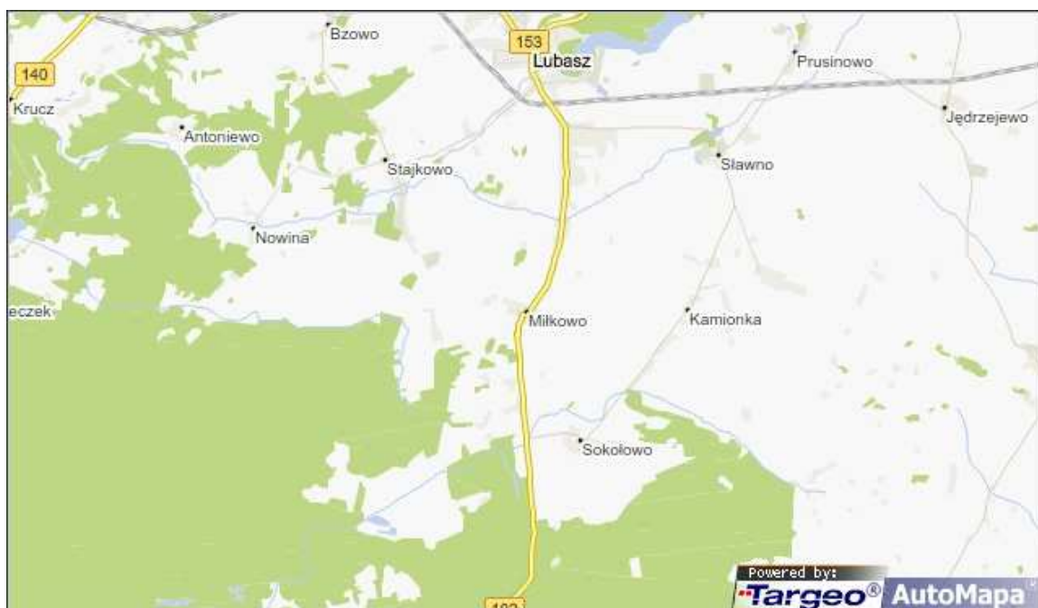
Ryc. Miłkowo na mapie samochodowej

Istotnym elementem wpływającym na wielkość ruchu turystycznego jest możliwość dotarcia potencjalnego turysty do wybranego miejsca wypoczynku. Położenie Miłkowa zapewnia łatwe połączenia komunikacyjne między innymi z Poznaniem i Piłą.