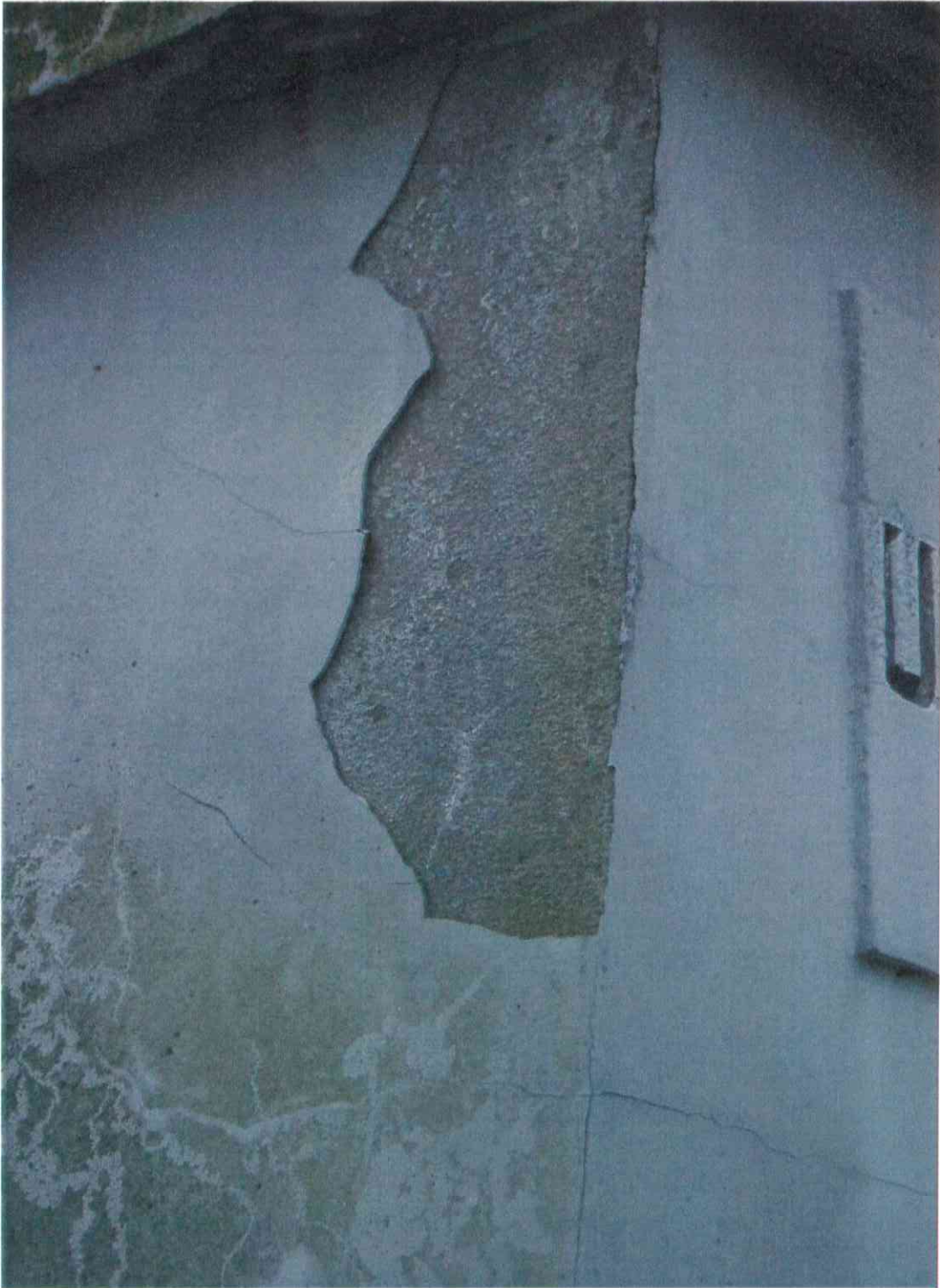
018 .POMNIK POWSTAŃCÓW WIELKOPOLSKICH – CMENTARZ PARAFIALNY W LUBASZU WOJ WIELKOPOSKIE – STAN ZACHOWANIA