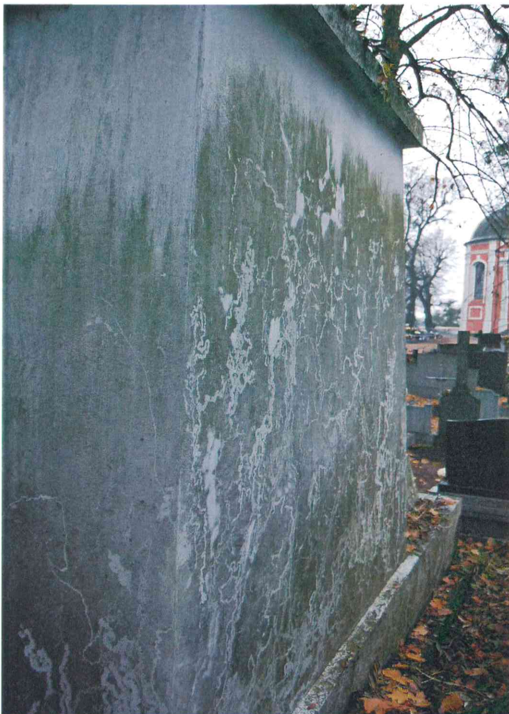
013.POMNIK POWSTAŃCÓW WIELKOPOLSKICH – CMENTARZ PARAFIALNY W LUBASZU WOJ WIELKOPOSKIE – STAN ZACHOWANIA