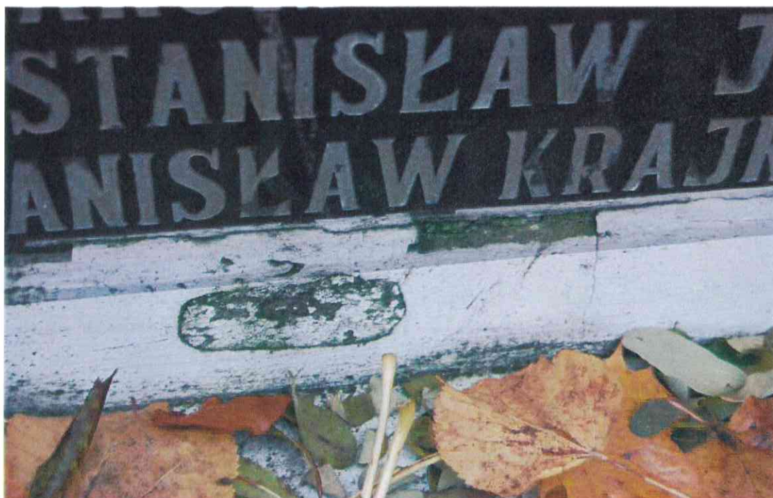
023POMNIK POWSTAŃCÓW WIELKOPOLSKICH – CMENTARZ PARAFIALNY W LUBASZU WOJ WIELKOPOSKIE – STAN ZACHOWANIA