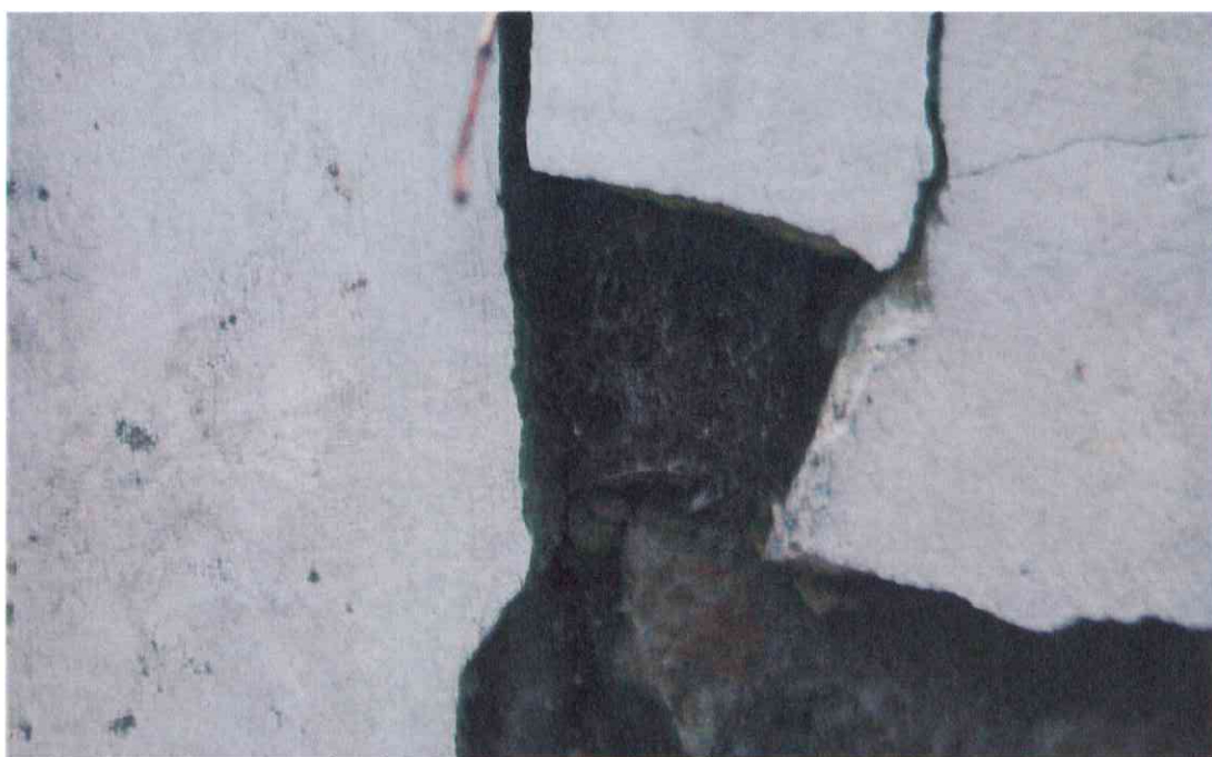
024POMNIK POWSTAŃCÓW WIELKOPOLSKICH – CMENTARZ PARAFIALNY W LUBASZU WOJ WIELKOPOSKIE – STAN ZACHOWANIA