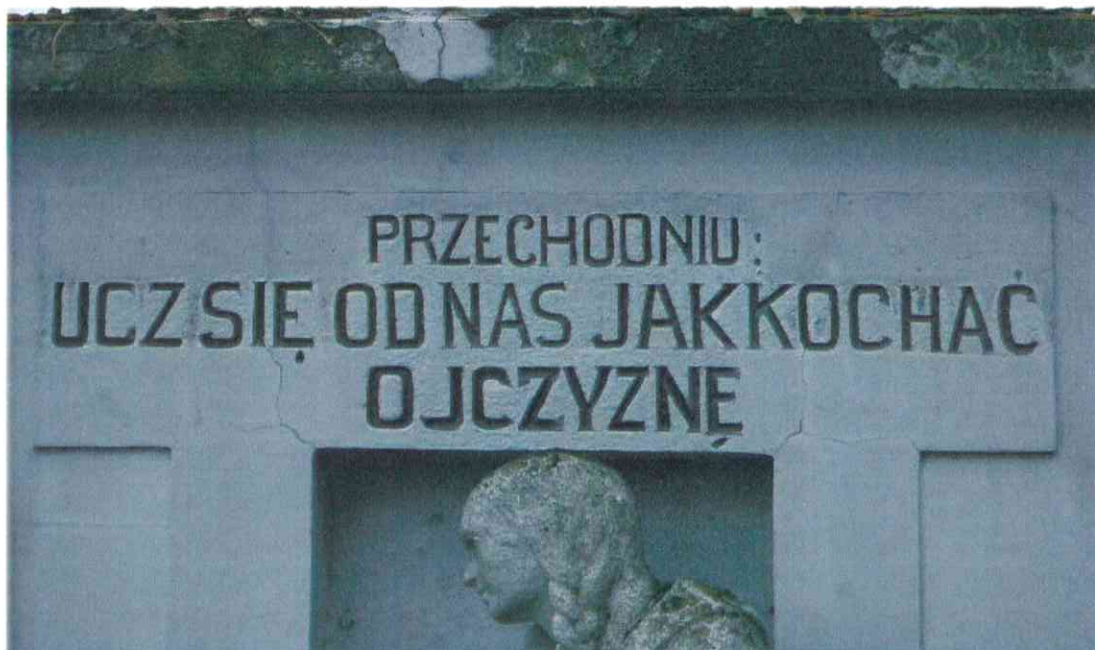
005POMNIK POWSTAŃCÓW WIELKOPOLSKICH – CMENTARZ PARAFIALNY W LUBASZU WOJ WIELKOPOSKIE – STAN ZACHOWANIA