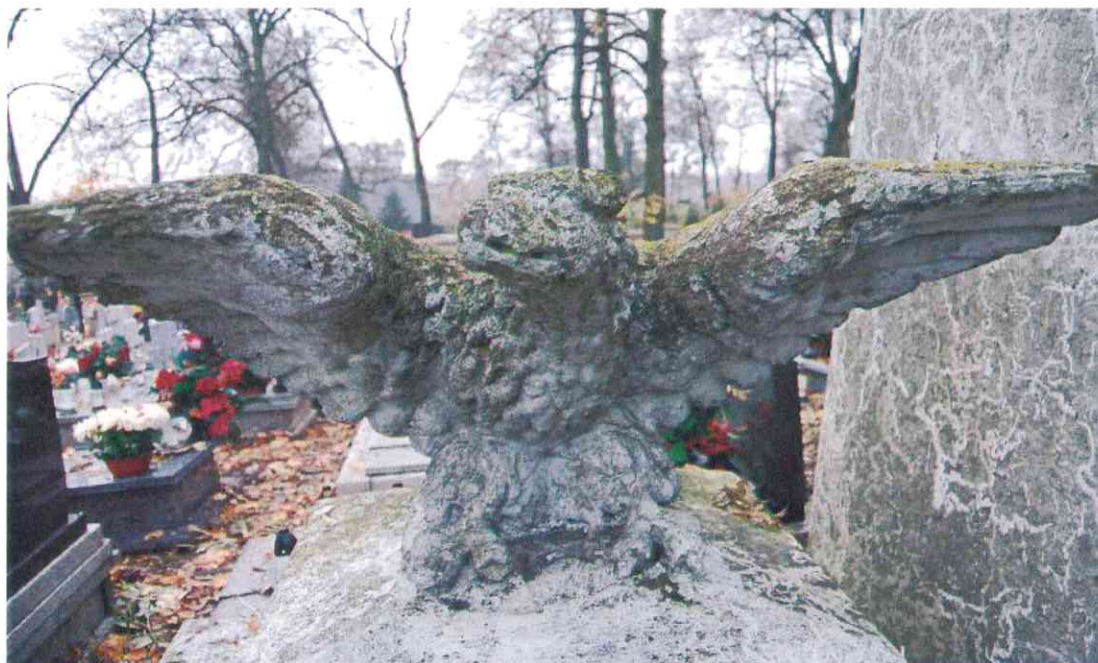
015 .POMNIK POWSTAŃCÓW WIELKOPOLSKICH – CMENTARZ PARAFIALNY W LUBASZU WOJ WIELKOPOSKIE – STAN ZACHOWANIA