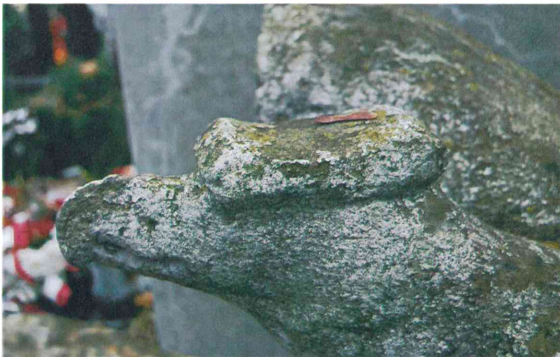
008POMNIK POWSTAŃCÓW WIELKOPOLSKICH – CMENTARZ PARAFIALNY W LUBASZU WOJ WIELKOPOSKIE – STAN ZACHOWANIA