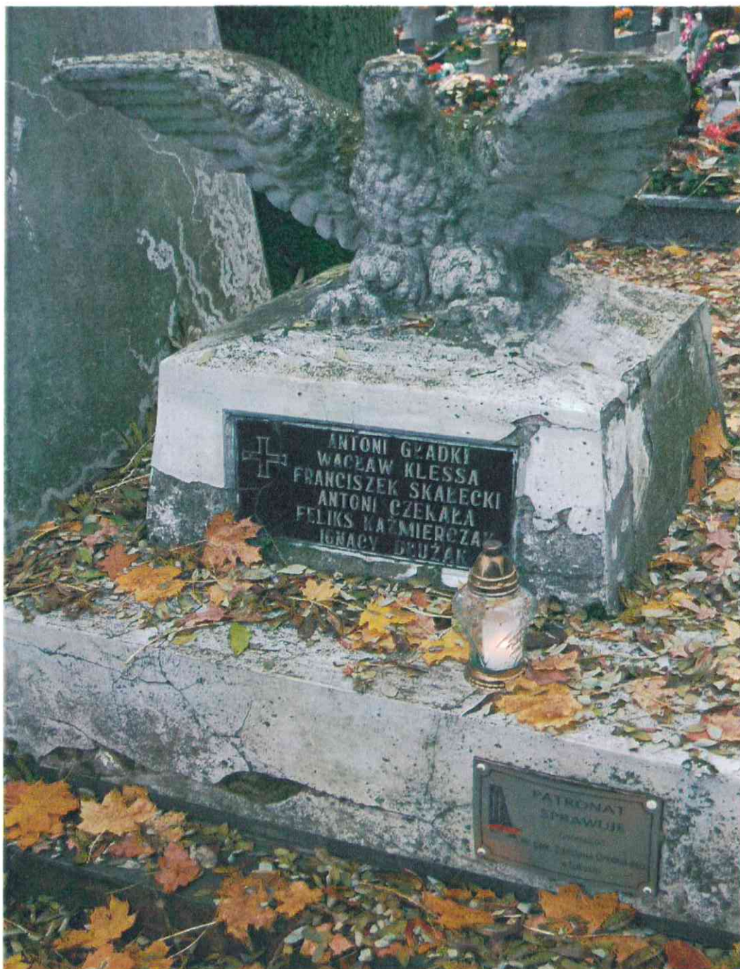
009.POMNIK POWSTAŃCÓW WIELKOPOLSKICH – CMENTARZ PARAFIALNY W LUBASZU WOJ WIELKOPOSKIE – STAN ZACHOWANIA