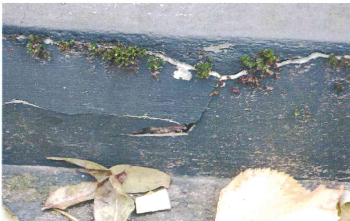
020POMNIK POWSTAŃCÓW WIELKOPOLSKICH – CMENTARZ PARAFIALNY W LUBASZU WOJ WIELKOPOSKIE – STAN ZACHOWANIA