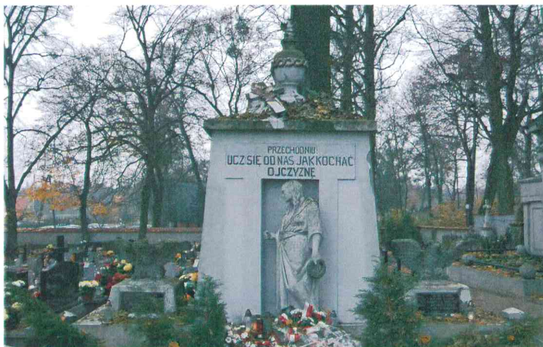
002.POMNIK POWSTAŃCÓW WIELKOPOLSKICH – CMENTARZ PARAFIALNY W LUBASZU WOJ WIELKOPOSKIE – STAN ZACHOWANIA