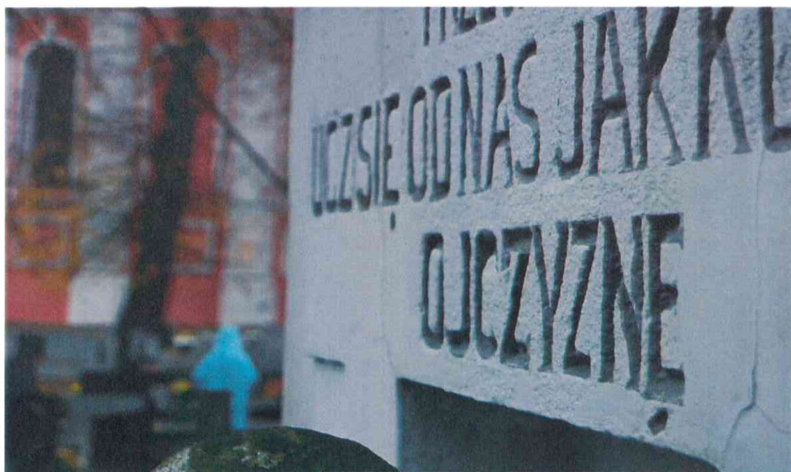
028POMNIK POWSTAŃCÓW WIELKOPOLSKICH – CMENTARZ PARAFIALNY W LUBASZU WOJ WIELKOPOSKIE – STAN ZACHOWANIA