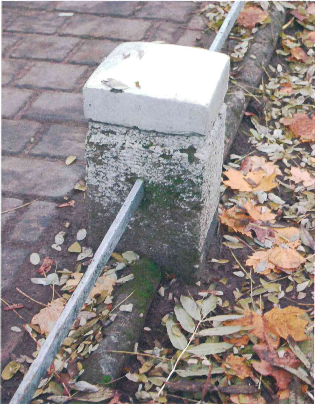
016 .POMNIK POWSTAŃCÓW WIELKOPOLSKICH – CMENTARZ PARAFIALNY W LUBASZU WOJ WIELKOPOSKIE – STAN ZACHOWANIA