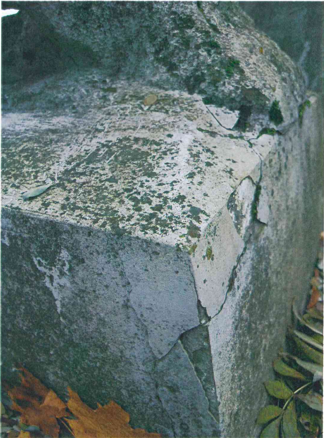
010POMNIK POWSTAŃCÓW WIELKOPOLSKICH – CMENTARZ PARAFIALNY W LUBASZU WOJ WIELKOPOSKIE – STAN ZACHOWANIA