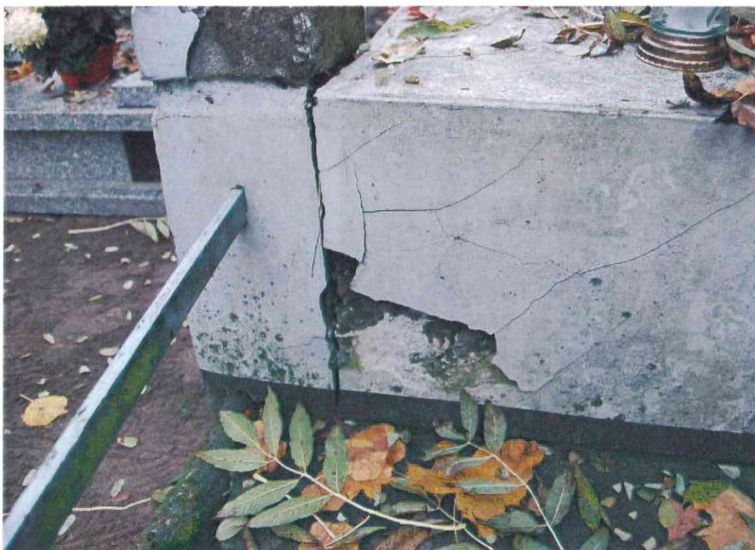
021POMNIK POWSTAŃCÓW WIELKOPOLSKICH – CMENTARZ PARAFIALNY W LUBASZU WOJ WIELKOPOSKIE – STAN ZACHOWANIA