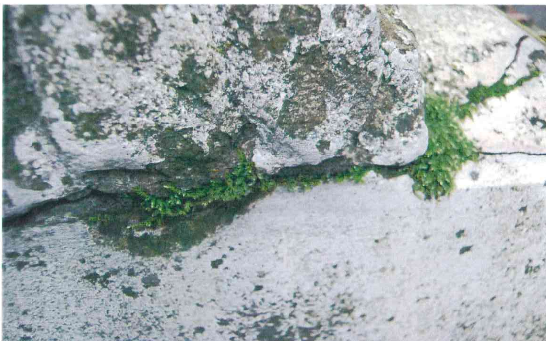
011 POMNIK POWSTAŃCÓW WIELKOPOLSKICH – CMENTARZ PARAFIALNY W LUBASZU WOJ WIELKOPOSKIE – STAN ZACHOWANIA