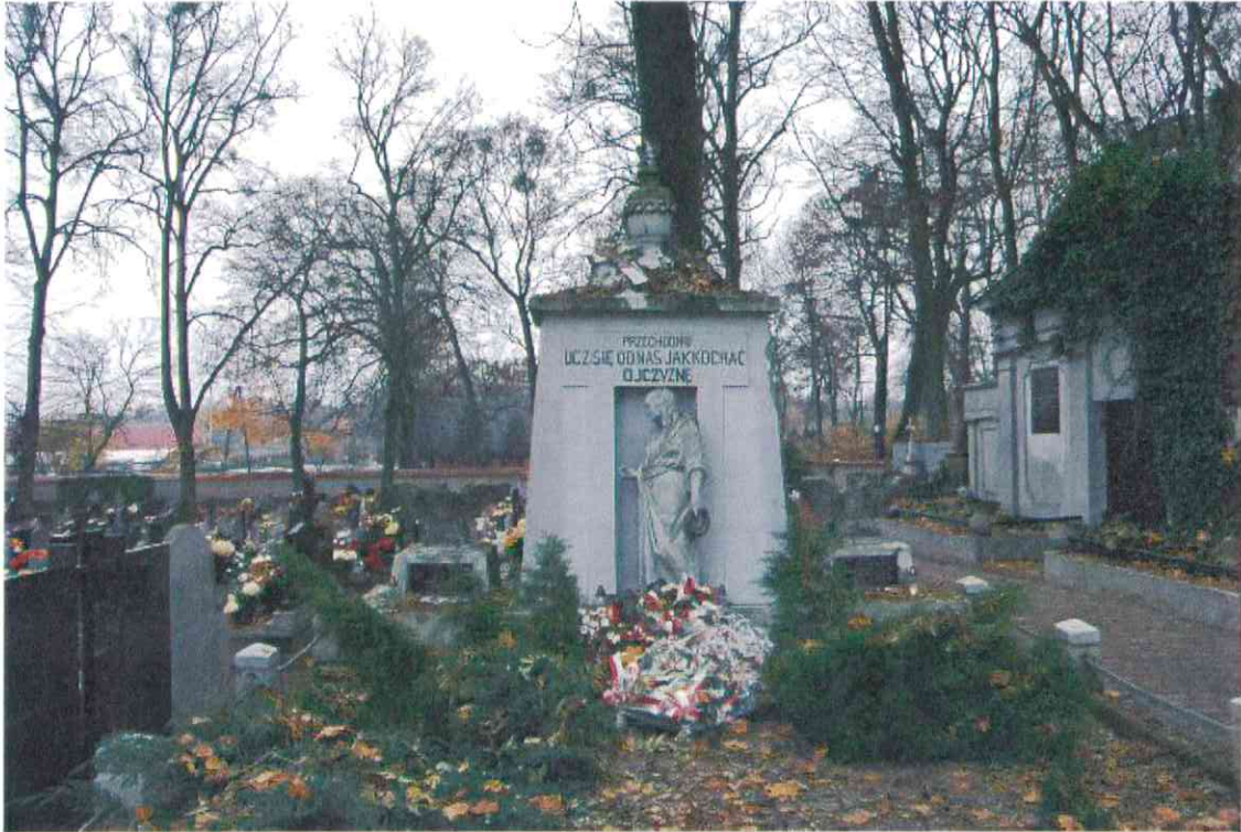
029.POMNIK POWSTAŃCÓW WIELKOPOLSKICH – CMENTARZ PARAFIALNY W LUBASZU WOJ WIELKOPOSKIE – STAN ZACHOWANIA