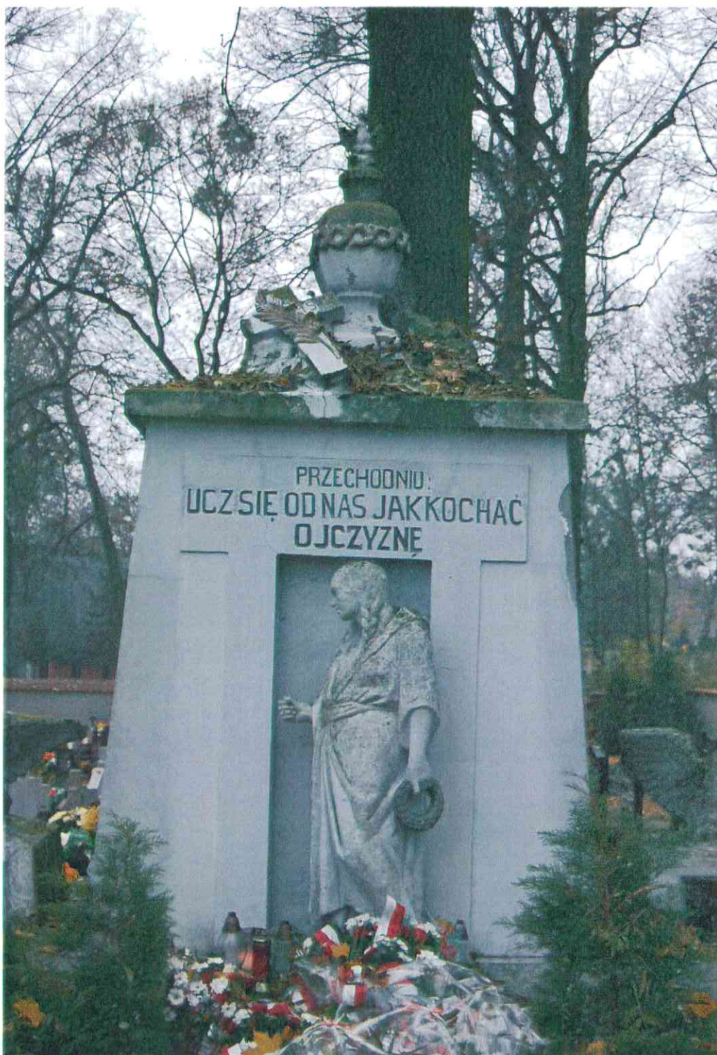
003POMNIK POWSTAŃCÓW WIELKOPOLSKICH – CMENTARZ PARAFIALNY W LUBASZU WOJ WIELKOPOSKIE – STAN ZACHOWANIA