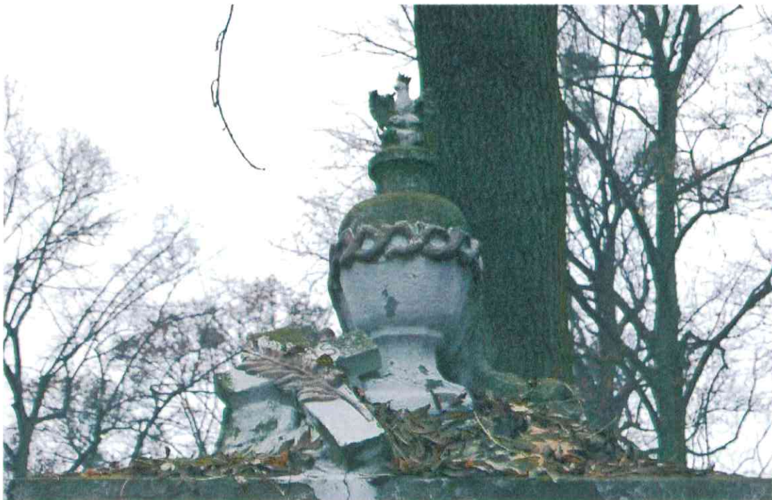
004POMNIK POWSTAŃCÓW WIELKOPOLSKICH – CMENTARZ PARAFIALNY W LUBASZU WOJ WIELKOPOSKIE – STAN ZACHOWANIA