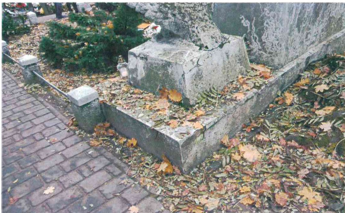
014 POMNIK POWSTAŃCÓW WIELKOPOLSKICH – CMENTARZ PARAFIALNY W LUBASZU WOJ WIELKOPOSKIE – STAN ZACHOWANIA