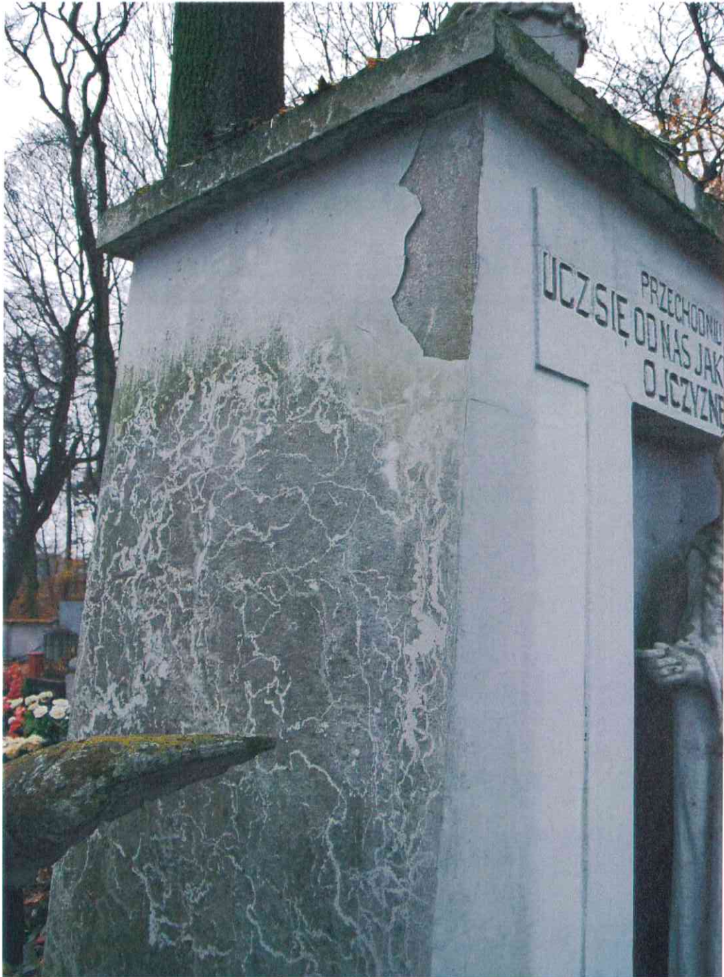
017POMNIK POWSTAŃCÓW WIELKOPOLSKICH – CMENTARZ PARAFIALNY W LUBASZU WOJ WIELKOPOSKIE – STAN ZACHOWANIA