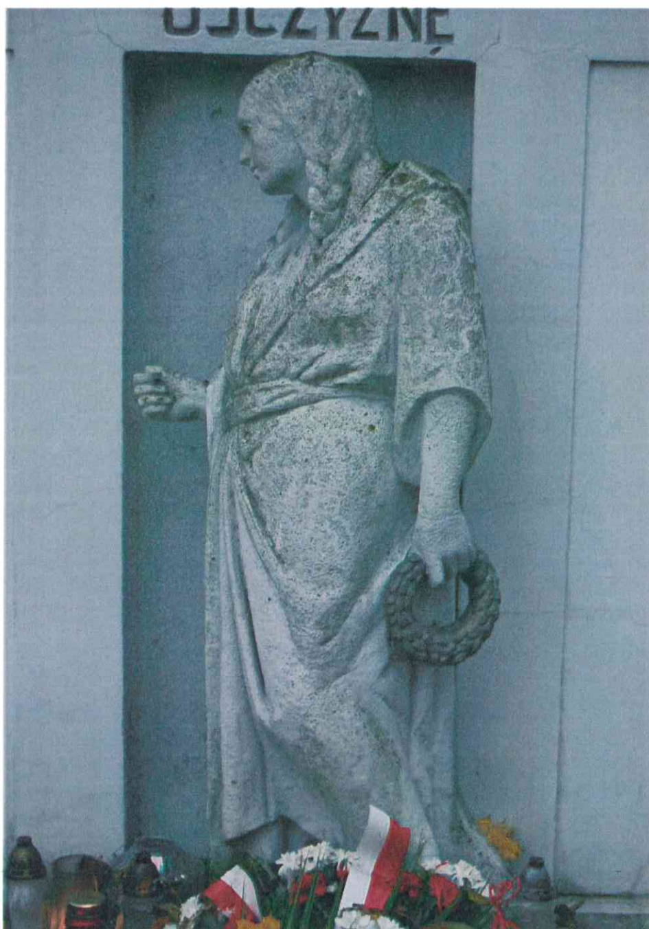
006POMNIK POWSTAŃCÓW WIELKOPOLSKICH – CMENTARZ PARAFIALNY W LUBASZU WOJ WIELKOPOSKIE – STAN ZACHOWANIA