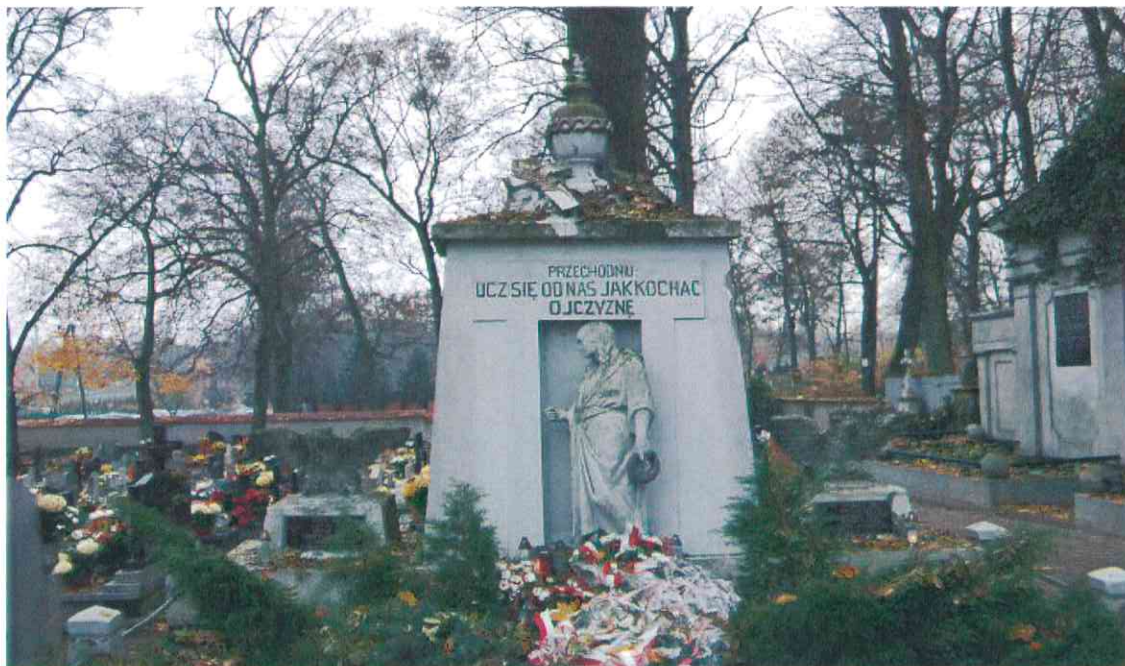
030POMNIK POWSTAŃCÓW WIELKOPOLSKICH – CMENTARZ PARAFIALNY W LUBASZU WOJ WIELKOPOSKIE – STAN ZACHOWANIA