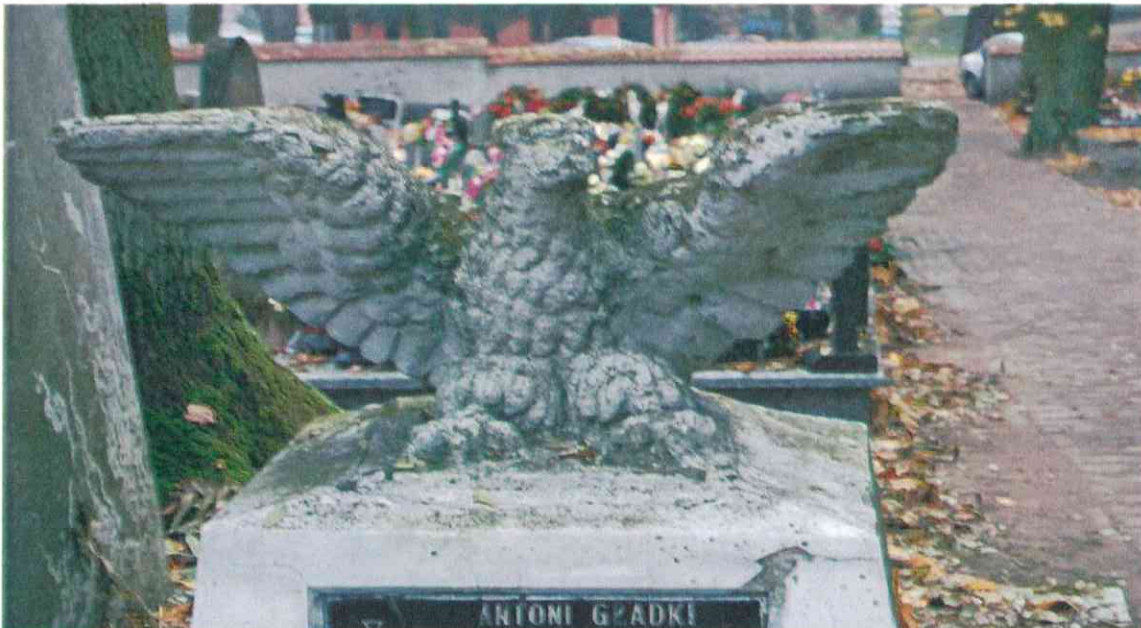
007POMNIK POWSTAŃCÓW WIELKOPOLSKICH – CMENTARZ – PARAFIALNY W LUBASZU WOJ WIELKOPOSKIE – STAN ZACHOWANIA