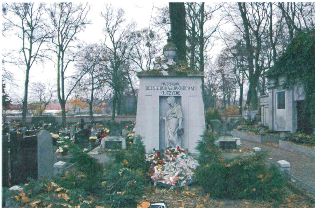
FOT001- POMNIK POWSTAŃCÓW WIELKOPOLSKICH – CMENTARZ PARAFIALNY W LUBASZU WOJ WIELKOPOSKIE – STAN ZACHOWANIA