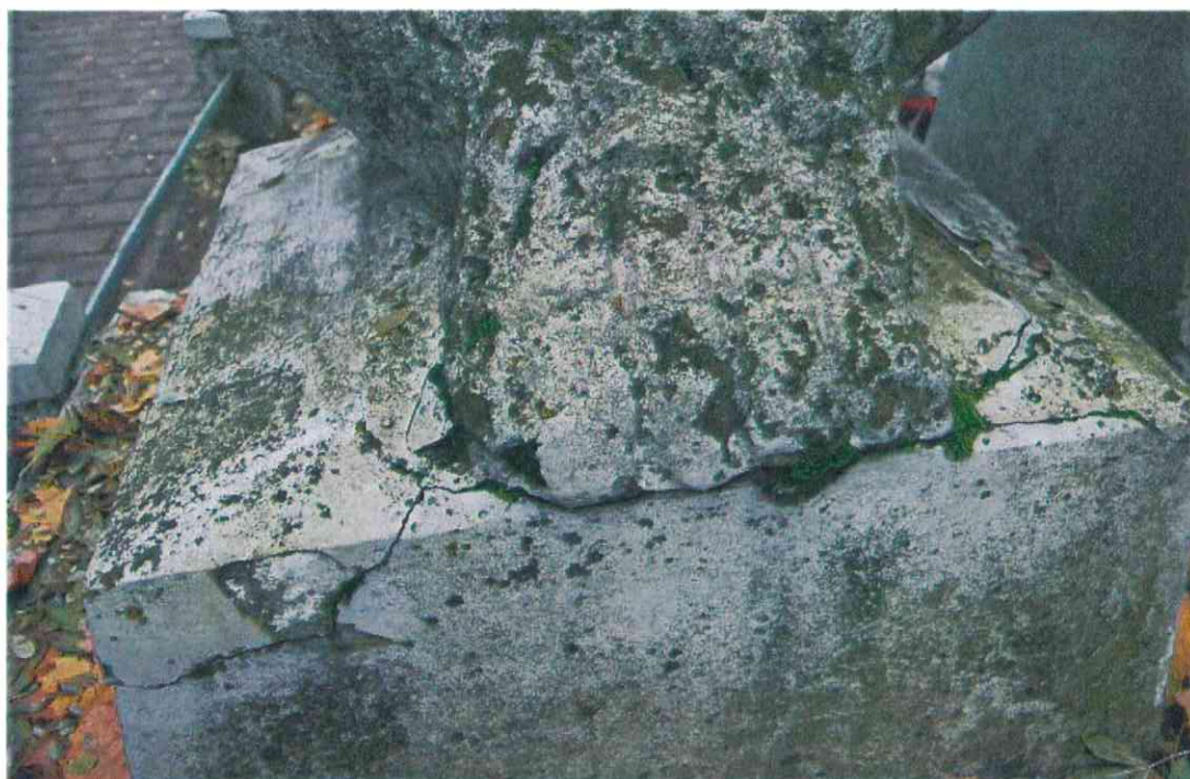
012 POMNIK POWSTAŃCÓW WIELKOPOLSKICH – CMENTARZ PARAFIALNY W LUBASZU WOJ WIELKOPOSKIE – STAN ZACHOWANIA