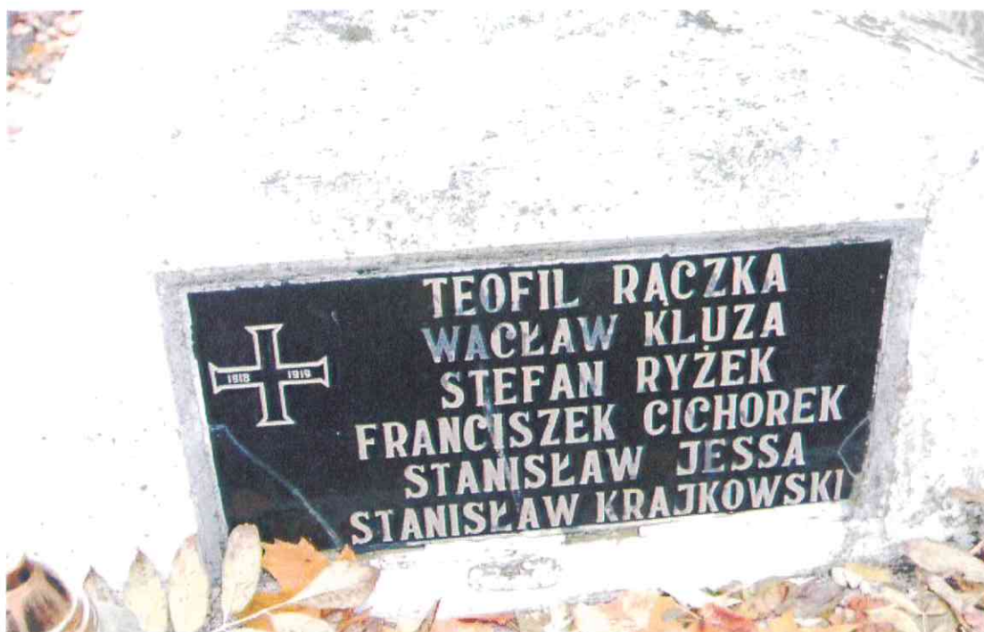
022POMNIK POWSTAŃCÓW WIELKOPOLSKICH – CMENTARZ PARAFIALNY W LUBASZU WOJ WIELKOPOSKIE – STAN ZACHOWANIA