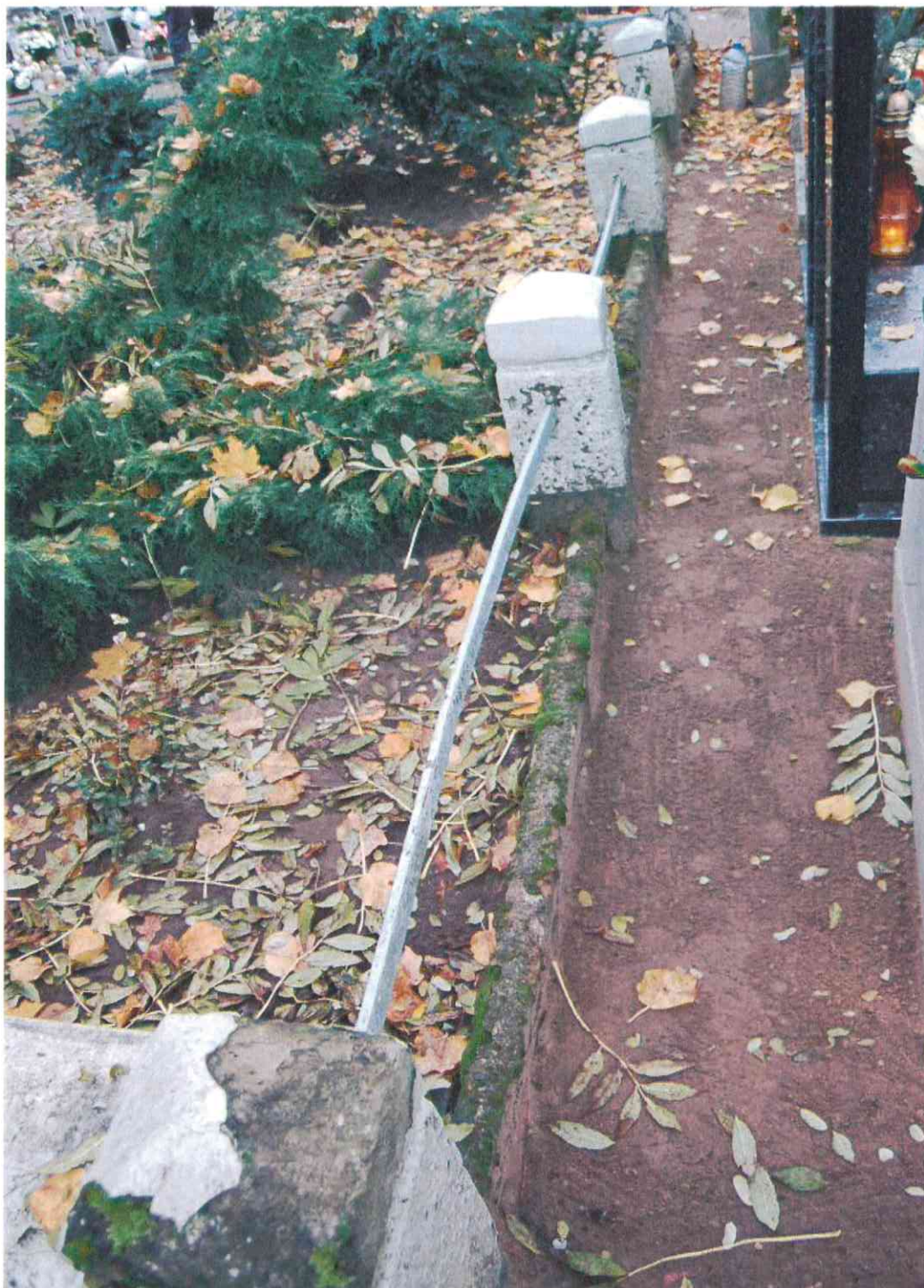
025 POMNIK POWSTAŃCÓW WIELKOPOLSKICH – CMENTARZ PARAFIALNY W LUBASZU WOJ WIELKOPOSKIE – STAN ZACHOWANIA