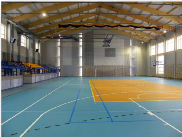
RYSUNEK 3. HALA WIDOWISKOWO-SPORTOWA W LUBASZU (1)

Hala oferuje możliwość organizacji imprez artystycznych: wystaw, konkursów, występów instrumentalno-wokalnych, itp.