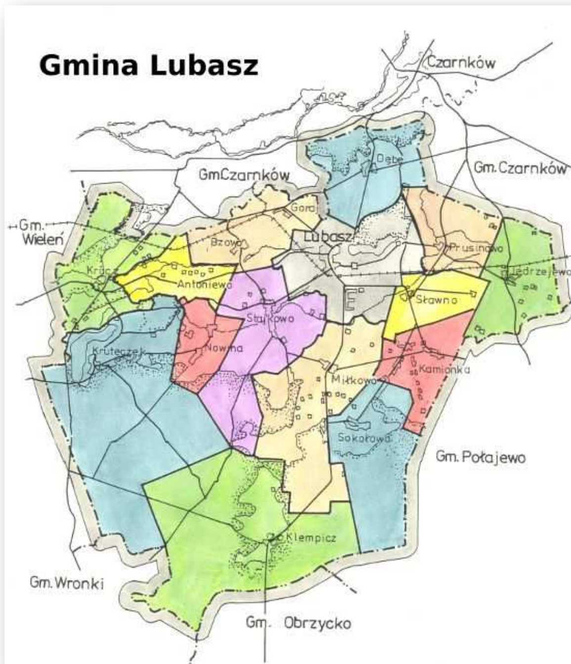
RYSUNEK 1. GMINA LUBASZ