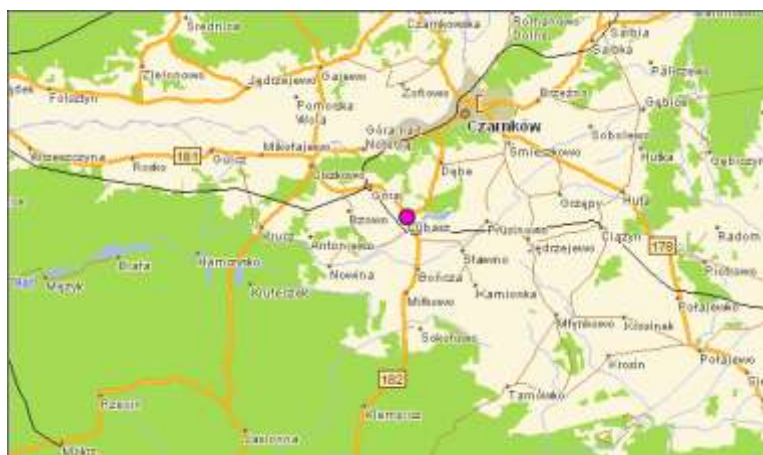
Rysunek Nr 1 Położenie Lubasza

Miejscowość Lubasz jest wsią gminną w powiecie czarnkowsko-trzcianeckim, województwo wielkopolskie, przy drodze wojewódzkiej Nr 182 Ujście – Międzychód.