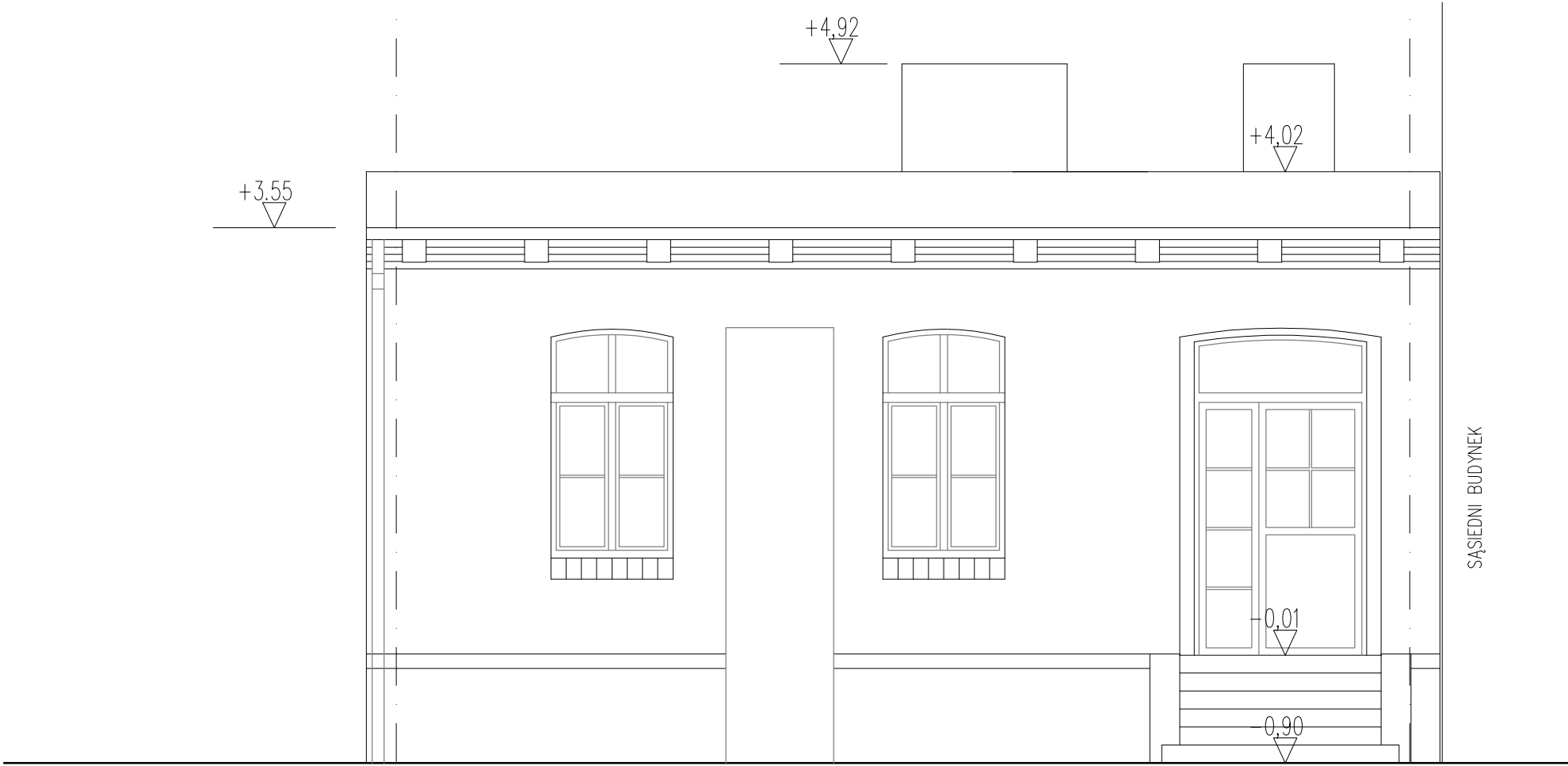
ELEWACJA FRONTOWA SKALA 1:50