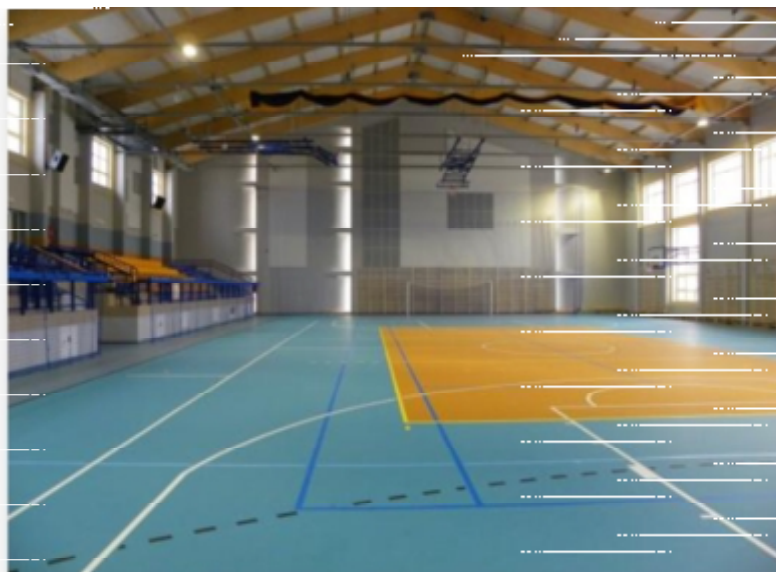
RYSUNEK 3. HALA WIDOWISKOWO-SPORTOWA W LUBASZU (1)