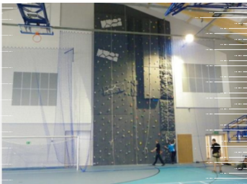
RYSUNEK 4. HALA WIDOWISKOWO-SPORTOWA W LUBASZU (2)